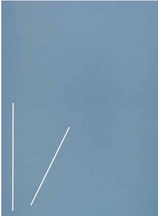
3543 (monks) 2019, Holzschnitt auf Papier Auflage: 4+1 AP 70 × 50 cm 750,- je Blatt (ungerahmt)