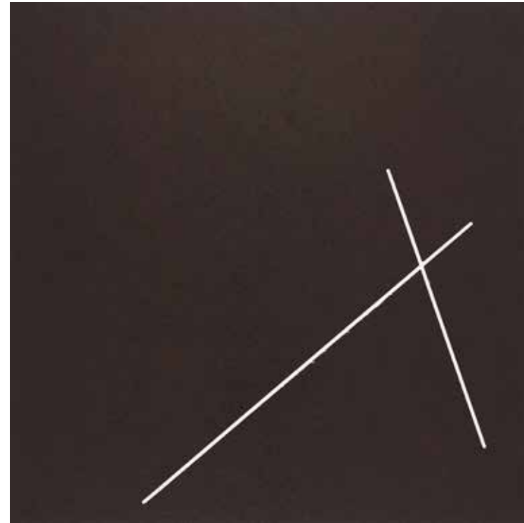
3510 (Le cachet de cire) 2019, Holzschnitt auf Papier Auflage: 4+1 AP 70 × 50 cm 750,- je Blatt (ungerahmt)